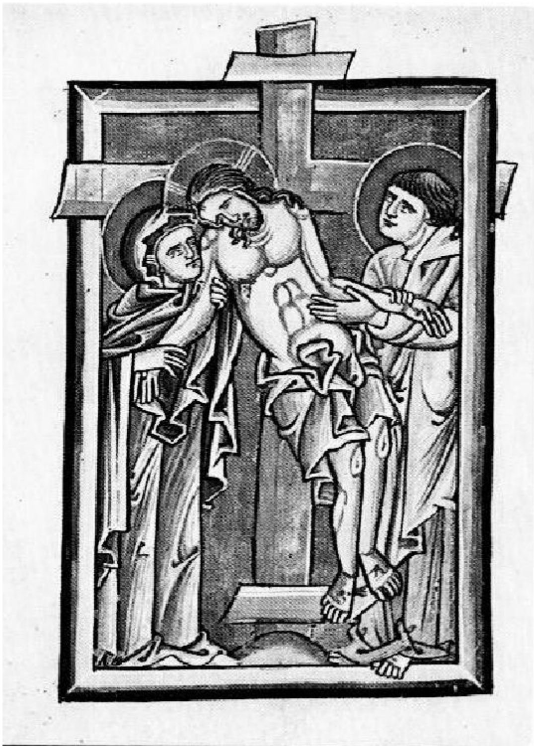
Kreuzabnahme, Psalterium St. Marienthal, 13. Jahrhundert